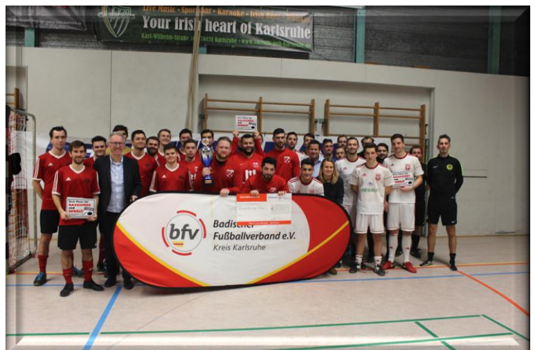
Siegerehrung des Futsal-Kreismeisters 2019 FC Germ. Neureut mit Spielern des Endspiel- gegners dem Karlsruher SV.