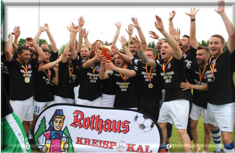
Kreispokalsieger 2016/17 ATSV Mutschelbach 2