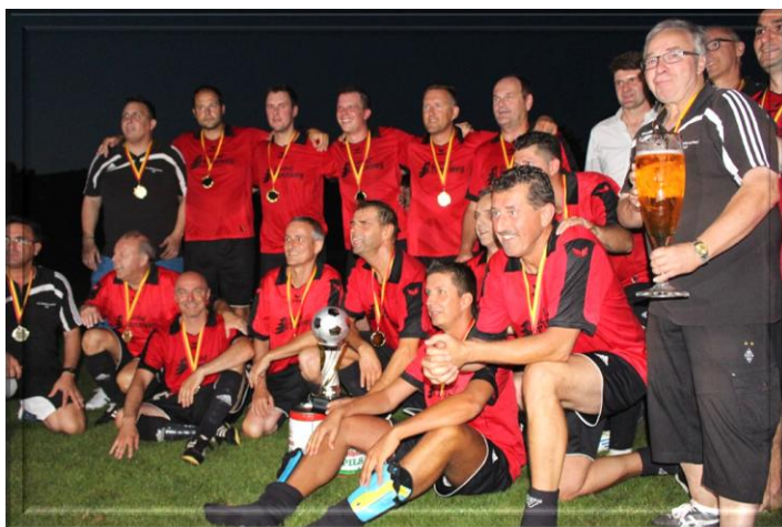
AH-Kreis Pokalsieger 2016 SC Wettersbach