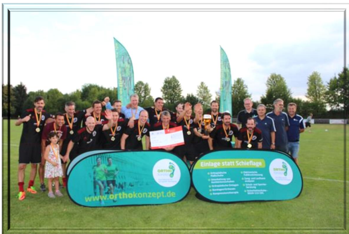
orthoKonzept-Kreispokal-Sieger AH 2017 und 2018

Die SpVgg Söllingen gewann dieses Spiel mit 2:1 und wurden erneut AH-Kreispokal-Sieger 2018.