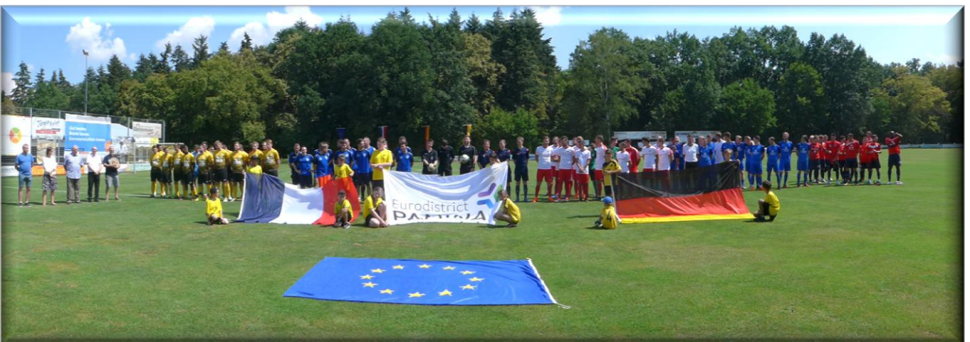
Im Jahre 2018 konnte der FC Alem. Eggenstein den 2. Platz um den Pamina-Supercup erreichen. Sieger wurde der französische Vertreter, der FR Haguenau 2.