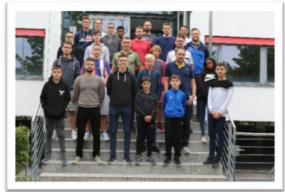
Lehrgang für Neu-Schiedsrichter im Haus des Sports

In den vergangenen Jahren wurden pro Saison zwei Lehrgänge zur Ausbildung neuer Schiedsrichter abgehalten. Wir konnten so viele neue Kameraden dazugewinnen, die uns dabei helfen können, den Spielbetrieb weiter aufrecht zu erhalten. Hierbei ist uns in der abgelaufenen Periode ein sehr guter Mix zwischen vielen jungen Neu-Schiedsrichtern, die ein Versprechen für die Zukunft sind, sowie Neu-Schiedsrichtern im mittleren