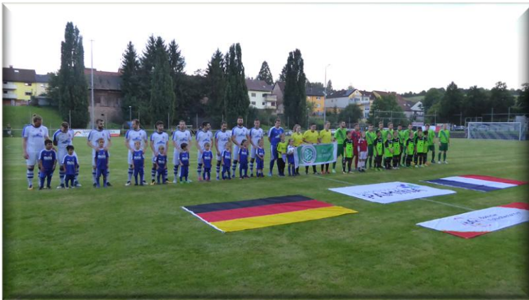
Pamina-Supercup-Sieger 2017 wurde der ATSV Mutschelbach 2