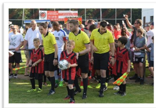
Karlsruher Gespann bei KSC-Testspiel

Weiterhin ist es unser oberstes Ziel, alle Spiele im Fußballkreis Karlsruhe bis zur D-Jugend mit ausgebildeten und qualifizierten Schiedsrichtern zu besetzen. In Zeiten, in denen sich die Schiedsrichterzahl nach unten entwickelt hat, hat sich die Anzahl der zu besetzenden Spiele sogar in die Gegenrichtung entwickelt. So hatten unsere Spieleinteiler in der Saison 2018/2019 9.215 Spielaufträge zu verteilen. Eine enorme Leistung, die unser aller Dankbarkeit erfordert!