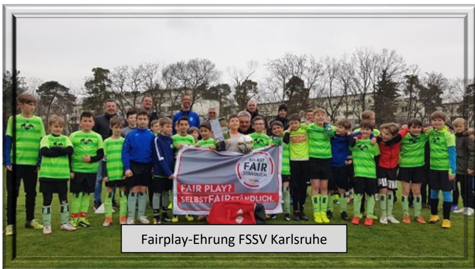
Fairplay-Ehrung FSSV Karlsruhe