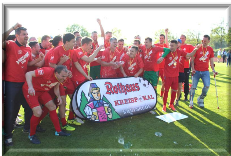
Kreispokalsieger 2018/19 SG Stupferich

Wer wird Kreispokalsieger 2019/2020???????