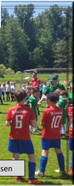
F-Jugendtag beim FV Al. Bruchhausen