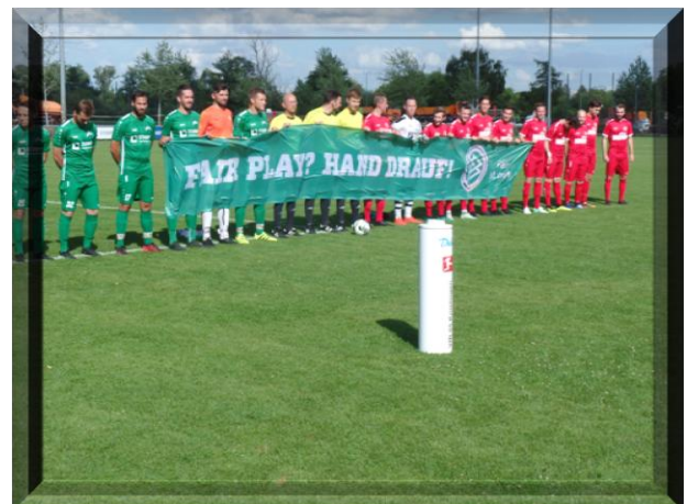
Fairplay-Ehrung im Rahmen des Eröffnungsspiels in der KL am 10.8.2019