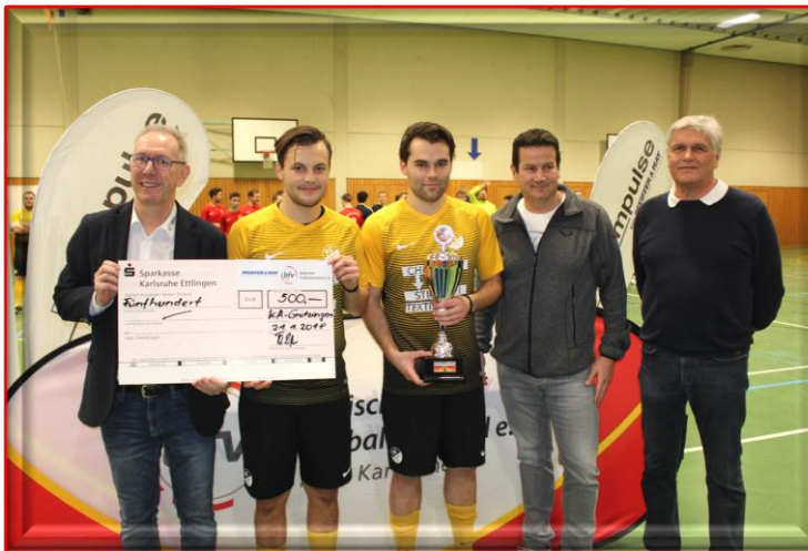
Siegerehrung für den FC Alem. Eggenstein 1. Futsal-Kreismeister 2018

Beisitzer für besondere Aufgaben (Ü-Wettbewerbe und Futsal)